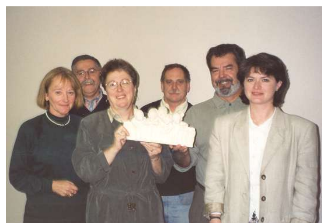
Prix annuel de l'Association des archivistes du Québec, catégorie « Organisme public » (1997)